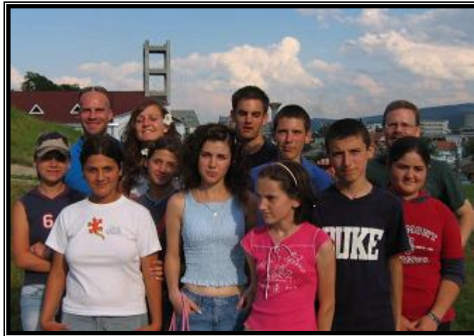
El Equipo del Parque, 22.07.2005