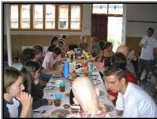
Parte del Equipo comiendo en la Viña de Iași:

Terminamos de hablar y orar por la gente y regresamos a la iglesia a las 18:00h, justo a tiempo para la cena.