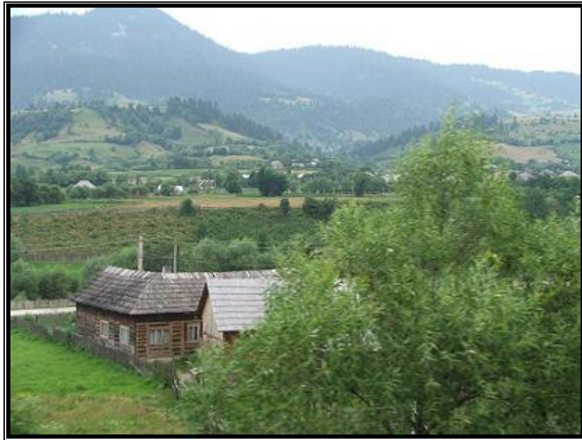
Un Paisaje de Transylvania, Rumania